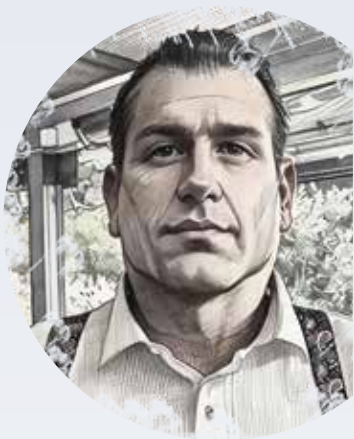
Γράφει ο Ανέστης Γερονικολάκης