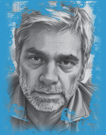
Με την υπογραφή του Απόστολου Χονδρόπουλου

Η κυβερνητική οπτική αποδίδεται από τα στελέχη του Μεγάρου Μαξίμου με μία χαρακτηριστική φράση: «Δεν έχουμε τίποτε άλλο να κάνουμε από το να σκίψουμε το κεφάλι και να δουλέψουμε πολύ πιο σκληρά και κάθε μέρα να παρτάσουμε, τουλάχιστον, μία θετική είδηση από την πολιτική μας».